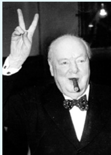
Winston Churchill, el hombre que predijo la Guerra Fría.