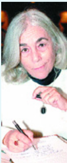
Carmen Martín Gaité

La ciudad en la que transcurre 'Entre visillos' puede ser cualquier capital castellana. El logro de esta novela, con la que la escritora Carmen Martín Gaité obtuvo el premio Nadal en 1957, es retratar sin exageraciones ni complejos la vida 'en provincias' durante la España de los 50, y hacerlo con un lenguaje ágil con el que desmenuza la personalidad de los protagonistas. La trama es sencilla: la repercusión que en la vida de los personajes tiene la llegada de un joven profesor de instituto.